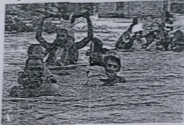
ਭਾਗ-ਸ (ਪਾਠ ਪੁਸਤਕਾਂ ਤੇ ਅਧਾਰਤ)

11) ਕਹਾਣੀ ਅਤੇ ਵਾਰਤਕ ਵਿੱਚੋਂ (ਪੁੱਛੇ ਗਏ ਅਨੁਸਾਰ ਛੇ ਪ੍ਰਸ਼ਨਾਂ ਵਿੱਚੋਂ ਕੋਈ ਪੰਜ ਹੱਲ ਕਰੋ):(5×1=5)